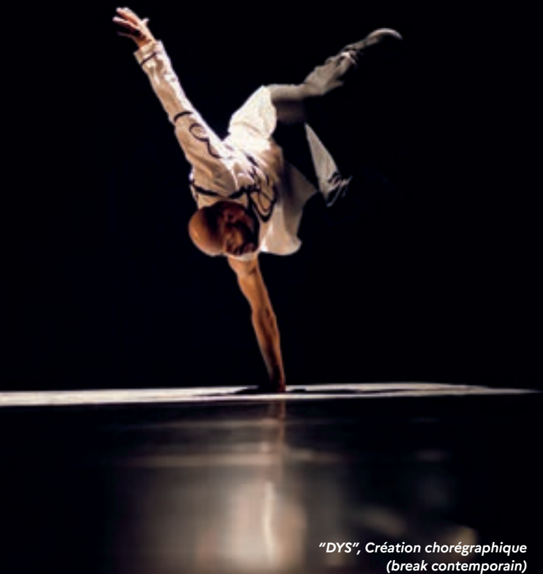
"DYS", Création chorégraphique (break contemporain)